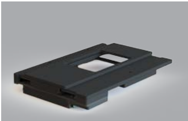
Mikroskopisch mit magnetischer Positionierung.